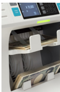
金種仕分時の スタッカーとリジェクトポケット